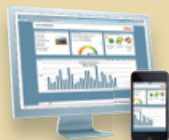
Portal StecaGrid Portal sieci Web