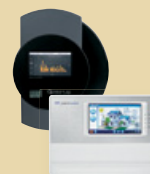
Solar-Log™ i Meteocontrol WEB'log Akcesoria